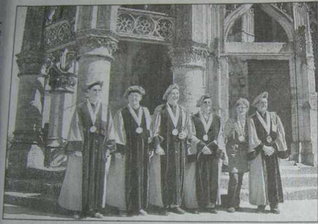
Les Sossons d'Orvaux devant la Recevresse.