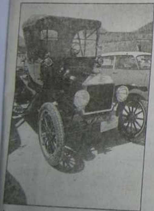
La Ford T, vedette du rassemblement.