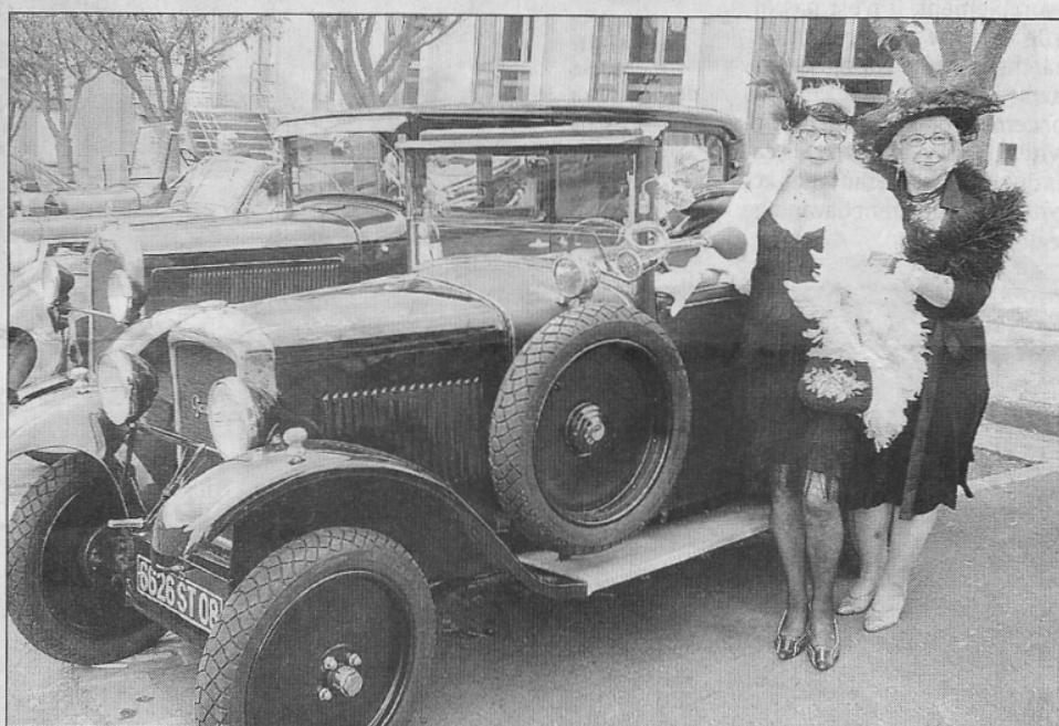
Les belles avec les belles.

Pour sa deuxième organisation, le grand prix rétro de la ville de Carignan aura connu un succès qui va sans aucun doute pousser les organisateurs à poursuivre dans cette direction la présentation de ces petites merveilles que sont ces belles voitures de jadis.